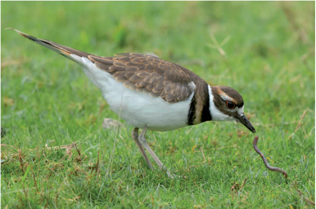
Chorlito culirrojo Charadrius vociferus . Cabo Udra (Pontevedra), 13 de noviembre de 2014.