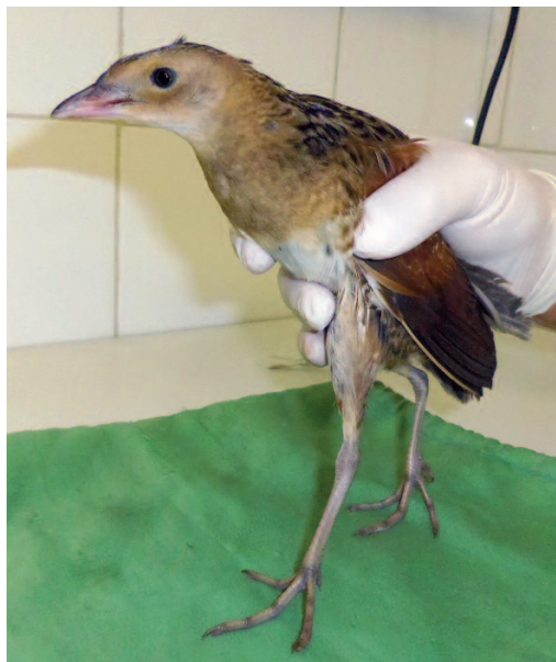
Guión de codornices Crex crex . Caicedo de Yuso, Lantarón (Álava), 31 de agosto de 2013.

Burgos. Busto de Bureba, un ejemplar cazado, fotos, 15 de septiembre (Íñigo Alonso; comunicado por José L. Lobo) (1). Pino de Bureba, un ejemplar cazado, fotos, 15 de septiembre (David Martínez; comunicado por José L. Lobo) (1). Ranera, un ejemplar cazado, fotos, 15 de septiembre (Íñigo Alonso; comunicado por José L. Lobo) (1).