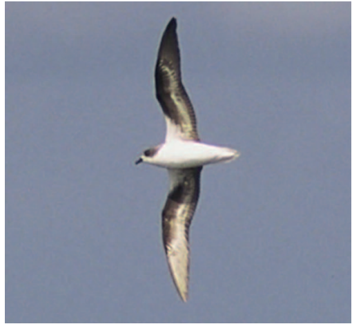
Petrel freira Pterodroma madeira . Mar frente a Estaca de Bares (A Coruña), 6 de agosto de 1995.

Así pues, no hay un patrón claro de aparición en el Atlántico Norte, donde se obtienen registros prácticamente en cualquier época del año. Lo más probable es que la mayor parte de las citas se refieran solo a unos pocos individuos que se observan en distintos lugares.