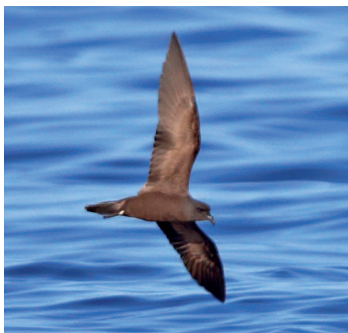
Paíño de Swinhoe Oceanodroma monorhis . Banco de la Concepción (Las Palmas), 11 de septiembre de 2014.

(Océanos Índico y Pacífico tropicales en Japón, China, Corea y SE Rusia). La observación aquí incluida supuso la obtención de las primeras fotografías de la especie en aguas españolas, lo que a su vez permitió apreciar una anilla metálica en la tibia de la pata izquierda del ejemplar. Ello nos lleva a plantearnos dónde había sido capturado y anillado. A pesar de que el año en que se produjo esta observación se habían anillado dos ejemplares en Fair Isle, Shetland (siendo este el lugar con más ejemplares capturados en los últimos años), se pudo confirmar que todos ellos fueron anillados en el tarso de la pata derecha, lo que excluye este enclave como posible origen del ave vista en Canarias (David Parnaby/Fair Isle Bird Observatory, com. pers. ). Las otras opciones más probables son que se trate de un ave anillada en Salvajes, donde también se capturaron algunos ejemplares (aunque hace ya unos años) o incluso en Lanzarote, donde se capturó y anilló un paíño