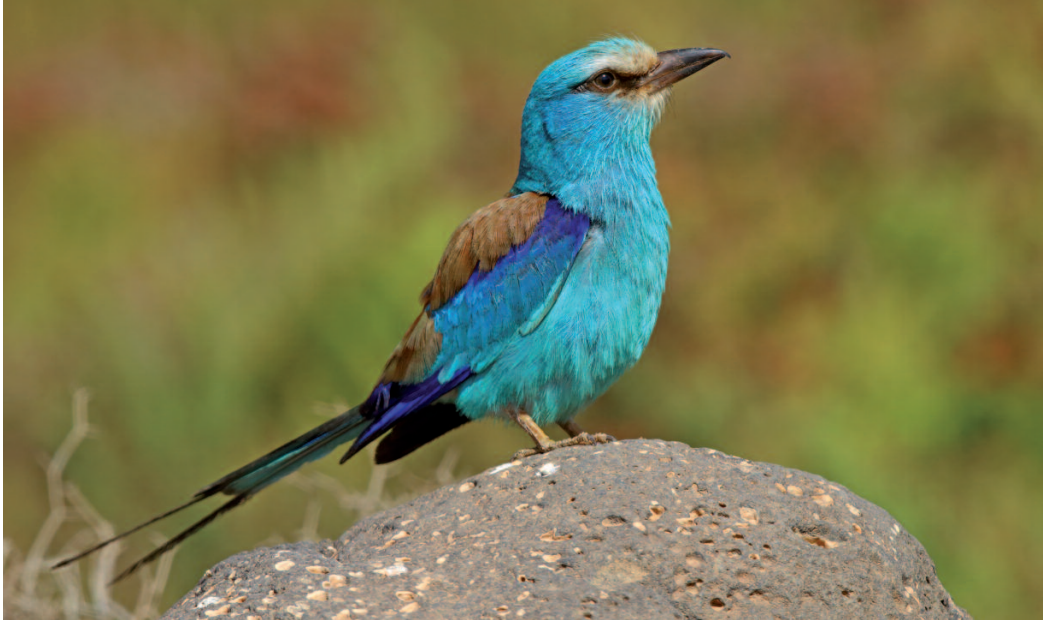
Carraca abisinia Coracias abyssinicus . Barranco de la Torre, Fuerteventura (Las Palmas), 9 de junio de 2014.

les pueden, al parecer, realizar dispersiones periódicas a larga distancia entre sus poblaciones asiáticas y europeas (Ramos et al. , 2016). La asociación con esta especie podría ser una explicación para la llegada accidental de abejarucos persas a Europa.