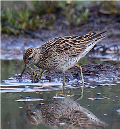
Correlimos acuminado Calidris acuminata . Ría de Villaviciosa (Asturias), 14 de septiembre de 2014.