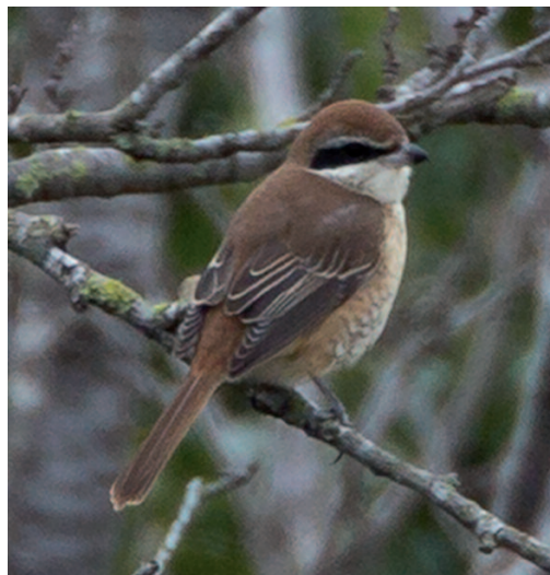
Alcaudón pardo Lanius cristatus. Delta del Ebro (Tarragona), 31 de diciembre de 2014.