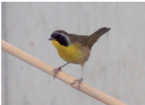
Mascarita común Geothlypis trichas . Codo de la Esparraguera (Cádiz), 19 de septiembre de 2014.

(Norteamérica). Nueva especie para la lista de las aves de España. Se trata de un taxón que realiza una migración de larga distancia, abandonando sus áreas de reproducción del sudeste de Alaska, suroeste del Canadá y Estados Unidos a partir de finales de agosto, rumbo a sus cuarteles de invernada en Centroamérica y orillas del Mar Caribe. La fecha de la observación coincide, en este sentido, con el patrón de aparición de varias especies de passeriforme americanas, que, empujadas por