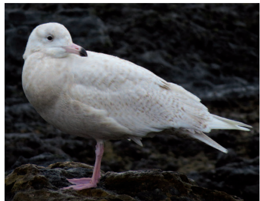
Gavión hiperbóreo Larus hyperboreus . Caleta de Sebo, La Graciosa (Las Palmas), 23 de enero de 2014.

2014. A Coruña. Camariñas, uno de primer invierno, 11 de enero (José L. Rabuñal) (1). Playa de Traba, Laxe, un adulto, 2 de febrero (José L. Rabuñal) (1). Un adulto, 1 y 2 de marzo (José L. Rabuñal) (1). Ensenada de a Insua, Ponteceso/Cabana de Bergantiño, uno de primer invierno, 2 de abril (José L. Rabuñal) (1). Playa de Nemiña, Muxía, tres de tercer invierno, fotos, 11 de enero (Fernando Pereiras) (2). Playa de a Concha, Cariño, un adulto, fotos, del 16 al 21 de enero (Ricardo Hevia) (2). Playa de Lariño, Carnota, un adulto, fotos, 20 de enero (Ramsés Pérez) (2). Playa del Pindo, Carnota, uno de cuarto invierno, fotos, 20 de enero (Ramsés Pérez) (2). Playa de Ézaro,