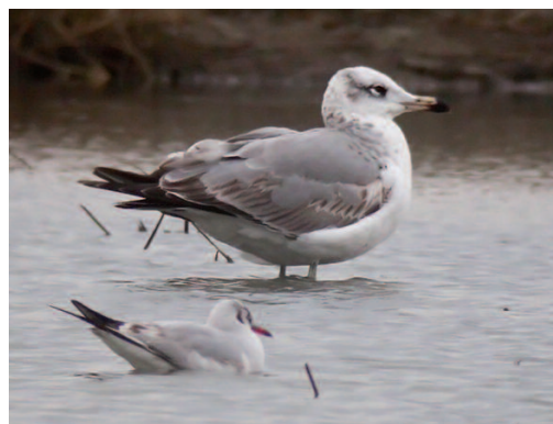
Gavión cabecinegro Larus ichthyaetus . Marjales de Sollana (Valencia), 21 de marzo de 2014.

Existen muy pocas observaciones en los países del oeste de Europa, aunque ha sido citada en la mayor parte del Paleártico Occidental (por ejemplo una en Reino Unido, una en Francia, dos en Suecia, tres en Holanda, etc...). En este contexto, se homologa la primera observación de esta especie en España. También en 2014 se produjo la cuarta observación para Austria (un adulto estival en el mes de abril) y, sorprendentemente, la primera observación para Noruega.