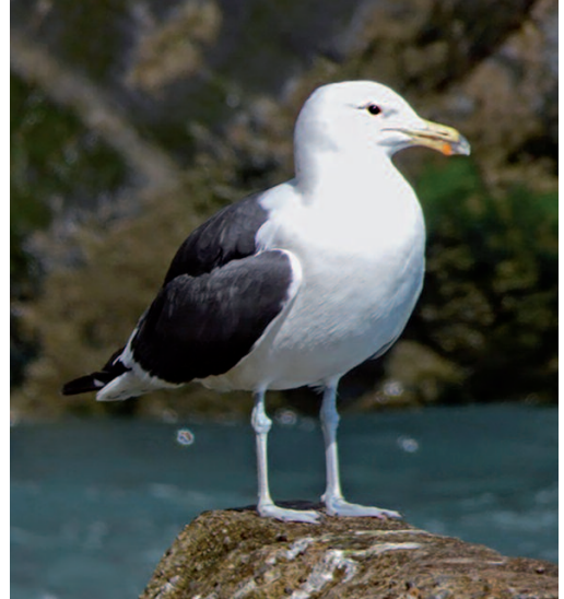
Gaviota cocinera Larus dominicanus . Puerto de Ondarroa (Bizkaia), 21 de abril de 2014.

esperable que apareciera algún ejemplar de esta especie en la costa atlántica de España. Existe un registro previo aceptado de Canarias en 2001.