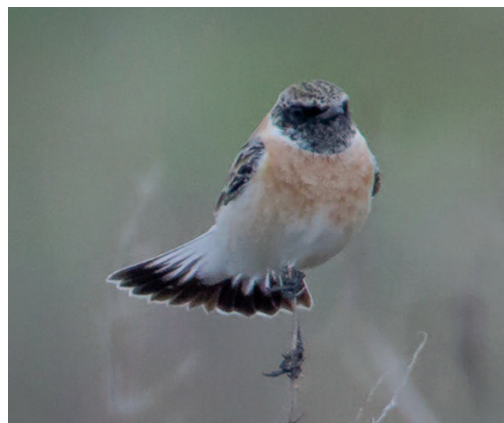
Tarabilla siberiana 'de Hemprich' Saxicola maurus hemprichii . Delta del Ebro (Tarragona), 12 de enero de 2012.

(Nordeste del mar Negro y norte del Caspio). La subespecie hemprichii de la tarabilla siberiana es un taxón de distribución realmente reducida, con un área de invernada no muy alejada de su zona de cría. Probablemente, el escaso número de observaciones fuera de esta se deba a ese motivo. No fue hasta el año 2012 cuando se llevó a cabo una revisión de la taxonomía y nomenclatura de las tarabillas de la zona situada entre los