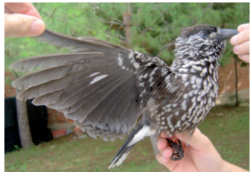
Cascanueces común Nucifraga caryocatactes . Villarroya de los Pinares (Teruel), 18 de octubre de 2012.

(Centro y norte de Europa, Asia). Segundo registro aceptado de esta especie en nuestro país. El cascanueces se encuentra bien distribuido por los bosques de coníferas de la región eurosiberiana del Paleártico. Generalmente es bastante sedentario, aunque la subespecie siberiana macrorhynchos realiza importantes movimientos irruptivos los años en que escasean las semillas de Pinus sibirica . Así, a lo largo de la historia se han detectado en Europa notables irrupciones de ejemplares siberianos,