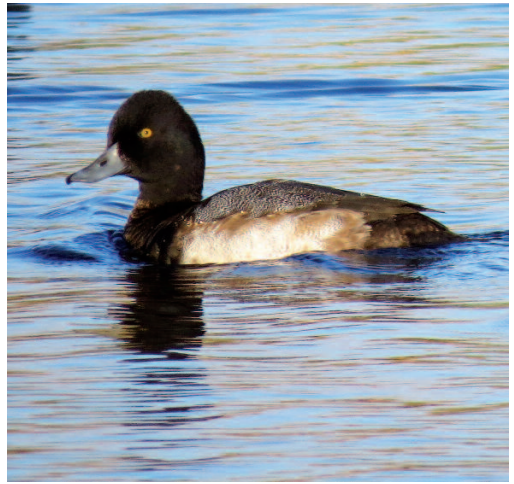
Porrón bola Aythya affinis . Salinas de Antigua Golf, Fuerteventura (Las Palmas), 27 de octubre de 2014.

(Norteamérica). El Comité considera probada la presencia regular de la especie, que deja de ser considerada rareza a partir del 1 de enero de 2016.