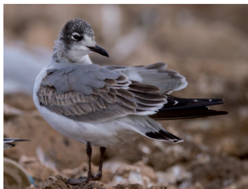
Gaviota pipizcan Larus pipixcan . Balsa del Pulguer (Navarra), 2 de diciembre de 2014.

2014. Cádiz. Urb. Costa Ballena Club de Golf, Rota/ Chipiona, uno de primer invierno, fotos, del 16 de noviembre al 1 de diciembre (Miguel Á. Rojas; Julio J. Ceballos; comunicado por Rafael García) (1).