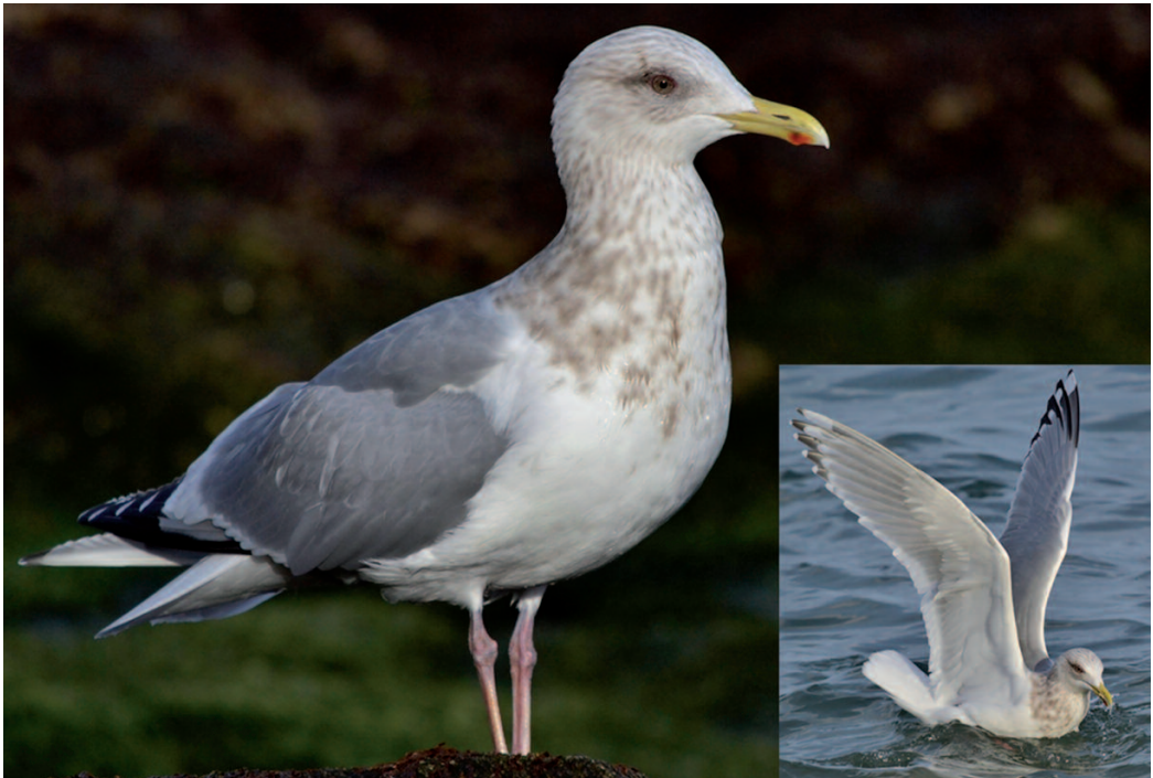
Gaviota esquimal Larus thayeri . San Ciprián (Lugo), 10 de marzo de 2013.

subespecie), el CR ha decidido homologar aquellos ejemplares que muestren caracteres propios de la población de Azores. Esto es, aquellas aves adultas en las que se observe una banda negra sólida en la quinta primaria (numeradas ascendentemente), espejo blanco solo en la décima primaria, coloración de partes superiores de un gris más oscuro que en michahellis y, sobre todo, cabeza estriada bien definida, formando un capuchón que acaba súbitamente por debajo de la nuca cuando el ave está en posición de descanso. Debido a la gran variabilidad de este complejo, de momento, y siguiendo lo que ya hacen otros comités europeos como el irlandés o el británico, las aves que reúnan este conjunto de características serán homologadas con la fórmula que se inaugura en este informe, es decir, 'aves presentando rasgos de L. m. atlantis '. Así pues, el Comité anima a todos aquellos observadores que localicen un ejemplar que encaje con este taxón a que documenten la observación lo mejor posible y la remitan al CR para su estudio y homologación.