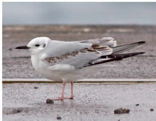
Gaviota de Bonaparte Larus philadelphia . Puerto de las Palmas, Gran Canaria (Las Palmas), 15 de febrero de 2014.

mayo (Jofre Sendrós et al. ) (6). L'Estany d'Europa, Aiguamolls de l'Empordà, Castelló d'Empúries, un macho adulto, fotos, del 12 al 16 de agosto (Rosa Matesanz et al. ; Marc Casas) (2).