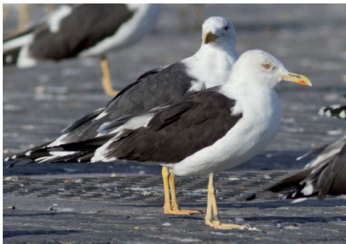
Gaviota sombría Larus fuscus fuscus . Puerto pesquero de Málaga (Málaga), 6 de febrero de 2007.

(Báltico). El Comité considera que solo se pueden homologar ejemplares que porten anilla