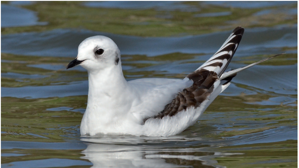
Gaviota rosada Rhodostethia rosea . Desembocadura del río Lagares, A Calzoa, Vigo (Pontevedra), 5 de marzo de 2014.