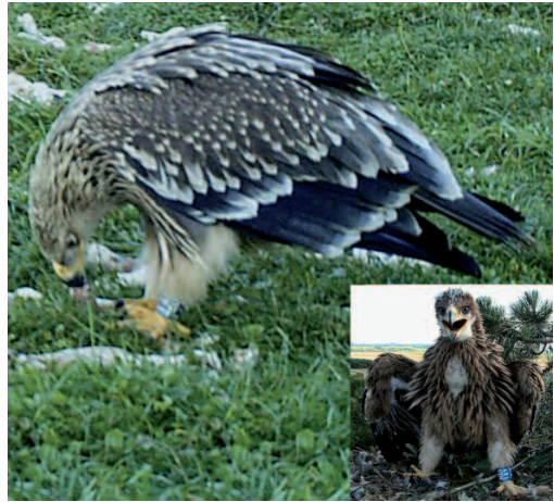
Águila imperial oriental Aquila heliaca . Villanúa (Huesca), 18 de octubre de 2014.

2014. Huesca. Villanúa, un juvenil con anillas de lectura a distancia procedente de Eslovaquia registrado mediante videotrampeo, 18 de octubre (7).