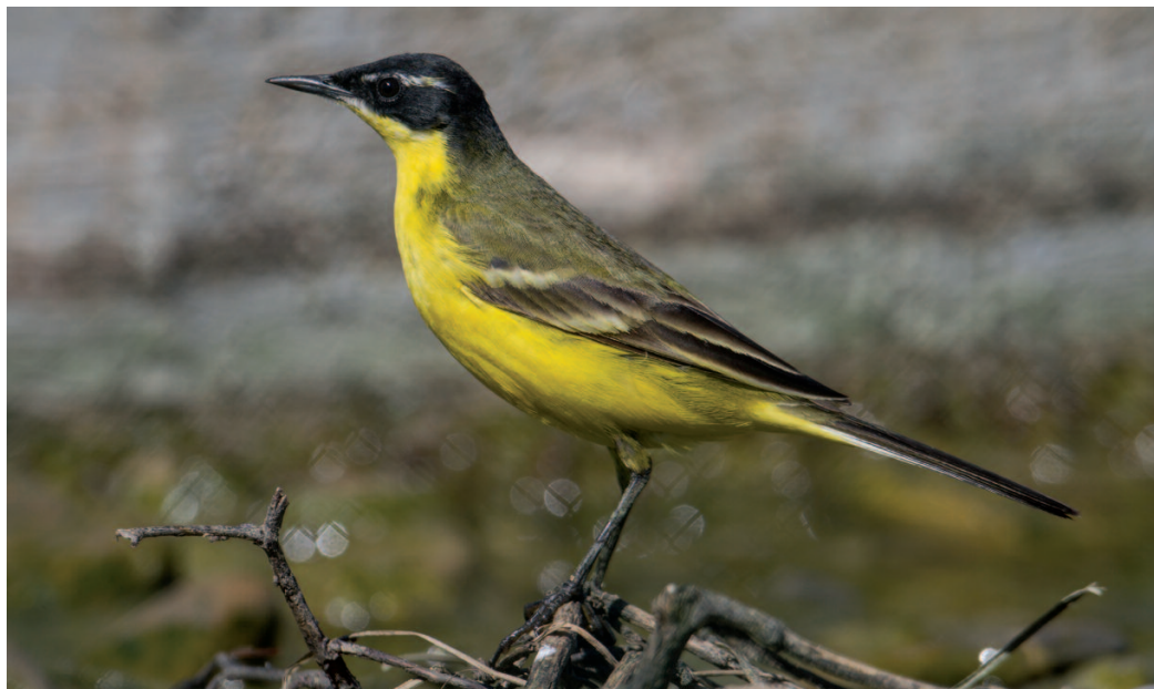
Lavandera boyera Motacilla flava feldegg/superciliaris . Depuradora de Sangüesa (Navarra), 21 de abril de 2013.

2012. Valencia. Tancat de la Milia, albufera de Valencia, Sollana, un macho, fotos, del 2 de julio al 1 de agosto (Antonio Alcocer; Carlos Varea, Antonio Alcocer) (25).