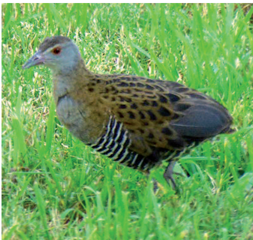
Guión africano Crex egregia . Puerto Rico, Gran Canaria (Las Palmas), 26 de diciembre de 2014.

Existen muy pocas observaciones de esta especie en el Paleártico Occidental: solamente las dos españolas, otra del lago Nasser (Egipto) en mayo de 1997 (Haavisto y Strand, 2000) y un ejemplar de Madeira que data de 1895 y que había sido también mal identificada inicialmente (Matias, 2009). Esta nueva observación que ahora se homologa, unido a que ese invierno 1999-2000 también se superó el récord de citas en España de calamoncillo africano (especie con un patrón de movimientos muy similar a la gallineta chica), apoyan una posible llegada natural de esta especie al Paleártico Occidental.