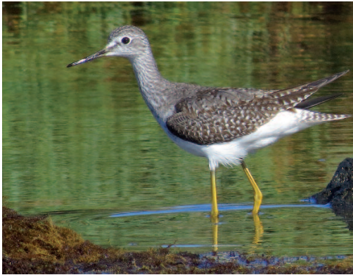
Archibebe patigualdo chico Tringa flavipes . Órzola, Lanzarote (Las Palmas), 24 de octubre de 2014.