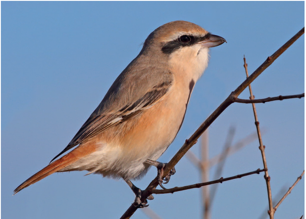
Alcaudón isabel Lanius isabellinus . Marjal de Almenara (Castellón), 15 de febrero de 2014.

(Centro y este de Europa, extremo occidental de Asia).