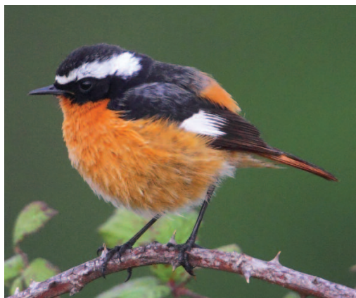
Colirrojo diademado Phoenicurus moussieri . Constantí (Tarragona), 18 de marzo de 2013.

2013. Tarragona. Constantí, un macho, fotos, del 18 al 24 de marzo (José A. Latorre; Jordi Vázquez) (2, 6).