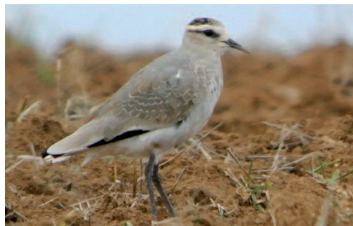
Avefría sociable Vanellus gregarius . Gálvez (Toledo), 9 de febrero de 2014.

2014. Navarra. Arrozales de Arguedas, Arguedas, un juvenil, fotos, del 7 al 20 de octubre (José Ardaiz;