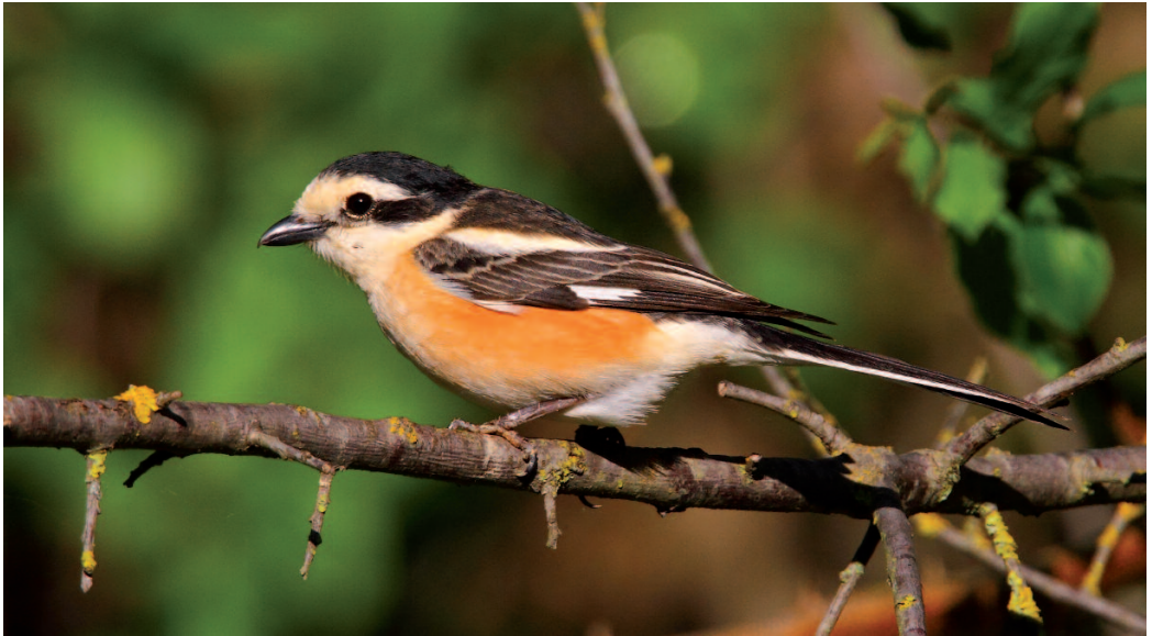
Alcaudón núbico Lanius nubicus . Mélida (Navarra), 12 de abril de 2014.

Se trata de una especie de muy escasa aparición en el norte y oeste de Europa, de la cual se han recopilado hasta el momento cinco citas en el Reino Unido, habiéndose registrado también como divagante en Francia, Alemania, Finlandia, Suecia y Noruega.