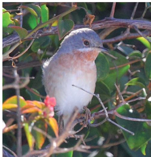
Curruca carrasqueña oriental Sylvia cantillans cantillans/albistriata . Uga, Lanzarote (Las Palmas), 11 de enero de 2013.

la península Ibérica como a otras formas de posible aparición. Inicialmente, se propuso la separación de la curruca carrasqueña Sylvia cantillans sensu lato en tres especies: la 'curruca carrasqueña oriental', que incluía las subespecies Sylvia cantillans cantillans (nidificante en el sur de Italia) y Sylvia cantillans albistriata (nidificante en los Balcanes y Turquía), la 'curruca carrasqueña occidental', que incluía las subespecies Sylvia inornata inornata (nidificante en el norte de África) y Sylvia inornata iberiae (nidificante en la península Ibérica) y, por último, la 'curruca subalpina' Sylvia subalpina (nidificante en Baleares, Córcega, Cerdeña y norte de Italia; Svensson, 2013). Finalmente, sin embargo, la mayoría de comités adoptaron una posición algo más conservadora, otorgando rango de especie solo a Sylvia subalpina y considerando el resto de taxones como subespecies de Sylvia cantillans (Sangster et al. , 2015). Así pues, a día de hoy se consideran rareza en España las subespecies cantillans y albistriata , la diferenciación de las cuales todavía no está del todo clara. Debido a ello, se decidió aceptar la observación aquí incluida (la primera para Canarias) como perteneciente a una de las dos subespecies sin llegar a especificar a cuál.