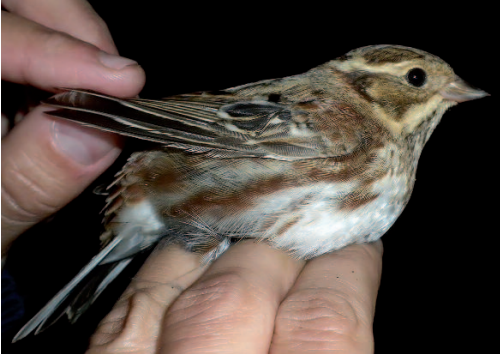
Escribano rústico Emberiza rustica . Salinas y Arenales de San Pedro del Pinatar (Murcia), 30 de octubre de 2009.