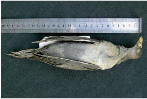
Gallineta chica Gallinula angulata . Laxe (A Coruña), 5 de febrero de 2000.

Existen muy pocas observaciones de esta especie en el Paleártico Occidental: solamente las dos españolas, otra del lago Nasser (Egipto) en mayo de 1997 (Haavisto y Strand, 2000) y un ejemplar de Madeira que data de 1895 y que había sido también mal identificada inicialmente (Matias, 2009). Esta nueva observación que ahora se homologa, unido a que ese invierno 1999-2000 también se superó el récord de citas en España de calamoncillo africano (especie con un patrón de movimientos muy similar a la gallineta chica), apoyan una posible llegada natural de esta especie al Paleártico Occidental.