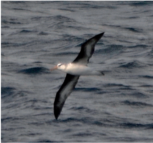
Albatros ojeroso Talassarche melanophris . Estaca de Bares (A Coruña), 21 de abril de 2012.

2013. Asturias. Punta de la Vaca, Gozón, un ejemplar, fotos, 1 de junio (Jorge Valella) (1).