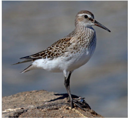
Correlimos culiblanco Calidris fuscicollis . Salinas del Carmen, Fuerteventura (Las Palmas), 30 de octubre de 2014.

Santa Cruz de Tenerife. Charca de El Fraile, Las Galletas, Arona, Tenerife, dos juveniles, fotos, 21 de octubre (Bencharo Rodríguez, Gustavo Tejera, José J.