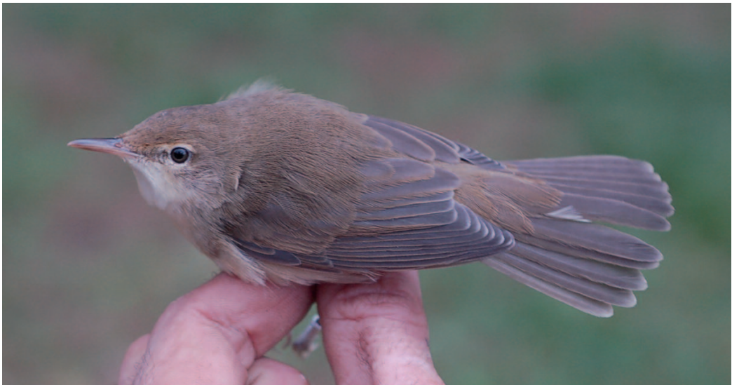
Carricero de Blyth Acrocephalus dumetorum . Delta del Llobregat (Barcelona), 9 de noviembre de 2014.

(Este de Europa, oeste de Asia). La observación aquí incluida supone la tercera cita que se homologa en España, todas ellas correspondientes a aves capturadas para anillamiento. Debido a su similitud con el carricero común y a sus hábitos esquivos, es más que probable que el carricero de Blyth pase inadvertido, especialmente cuando no se puede estudiar al ave en mano. A pesar de ello, en un alto porcentaje de las observaciones en el oeste de Europa no se capturó al ejemplar, de modo que bastó con fotografías de calidad media para asegurar la identificación.