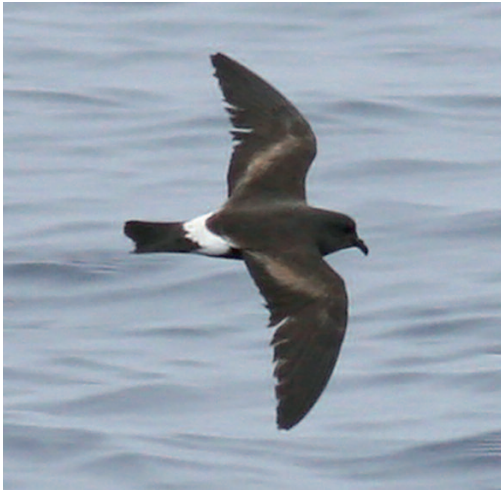
Paño de Madeira Oceanodroma castro . 20 millas al norte de Estaca de Bares (A Coruña), 22 de agosto de 2010.

campo y a menudo no se puede precisar a cuál de estos ‘nuevos’ taxones corresponde un ejemplar observado fuera de su área de distribución habitual. En España se ha podido comprobar la presencia de al menos dos taxones, siguiendo la nueva nomenclatura: el llamado ‘paño de Grant’ (nidificante en Canarias y el resto de archipiélagos macaronésicos durante el invierno) y el ‘paño de Madeira’ (nidificante en Madeira durante el verano y visitante habitual y relativamente numeroso de zonas clave como el banco de la Concepción; Gil-Velasco y Sagardía, 2015). Asimismo, cada año se observan ejemplares en muy bajo número que presentan características de paño de Monteiro ( Oceanodroma monteiroi ), un endemismo de las Azores que nidifica en periodo estival. En este sentido, el ejemplar de la observación aquí incluida presenta una cola bastante horquillada, un pico fino y ganchudo y una frente con una pendiente muy pronunciada, además de un plumaje relativamente desgastado en el mes de agosto. Todo ello encaja mejor con el paño de Monteiro, pero su escasez (alrededor de 200 parejas; Bolton et al. , 2008), su variabilidad, y el hecho de que aún se desconozcan sus movimientos, obliga a ser cautelosos a la hora de identificar un ejemplar fuera de su área de distribución. Por ello, se ha decidido aceptar esta observación como Oceanodroma