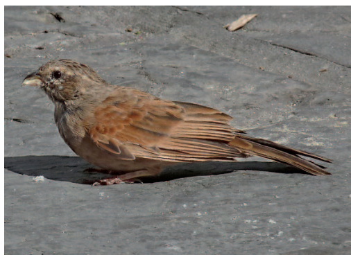
Escribano sahariano Emberiza sahari . Tarifa (Cádiz), 1 de agosto de 2009.