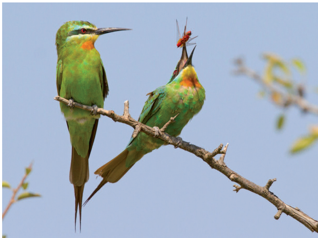
Abejaruco persa Merops persicus . Delfià (Girona), 24 de agosto de 2012.

(Noroeste de África y sudoeste de Asia). Los dos ejemplares observados en Delfià, Girona, constituyen el octavo y noveno registros homólogos de esta especie, que se suman a los anteriores de Cataluña, Aragón, Andalucía y Canarias. Se trata de la primera observación posnupcial en España, y una de las pocas en el contexto europeo, donde la mayoría de registros son de primavera (Ebels y van der Laan, 1994). Algunos caracteres morfológicos como las partes inferiores homogéneamente verdes, así como la localidad donde fueron observados, indican que probablemente se trate de la subespecie nominal de distribución asiática, taxón al que se adjudican la mayoría de las citas en Europa (Ebels y van der Laan, 1994). Se trata de una especie migrante con las zonas de invernada en África Subsahariana y, sobre todo, en el este de África Tropical. En ocasiones, migra en grupos mixtos con abejarucos europeos ( Merops apiaster ), (Fry y Kirwan, 2016), los cua-