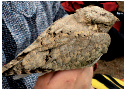
Chotacabras egipcio Caprimulgus aegyptius . La Lajita, Fuerteventura (Las Palmas), 29 de marzo de 2007.

(Norte de África y desde Egipto al este hasta Kazajstán). Primera cita en España de esta especie migrante que tiene los lugares de cría más cercanos en las zonas semidesérticas y desérticas de Marruecos, Argelia y Túnez, invermando en el