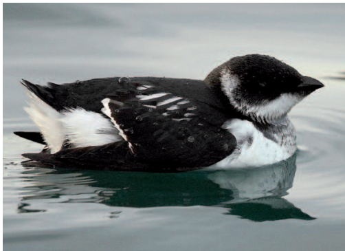
Mérgulo atlántico Alle alle . Castro-Urdiales (Cantabria), 25 de octubre de 2014.

La especie ha sufrido un marcado declive debido al calentamiento global y sus poblaciones y,