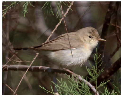
Zarcero pálido Iduna pallida . Barranco de la Torre, Fuerteventura (Las Palmas), 14 de junio de 2014.