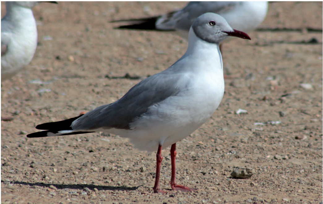
Gaviota cabecigrís Chroicocephalus cirrocephalus . Vertedero de Pinto (Madrid), 23 de marzo de 2014.

(África al sur del Sahara y Sudamérica). Se homologan dos observaciones de esta gaviota del hemisferio sur, sin descartar que pueda tratarse del mismo ejemplar en ambos casos. El ejemplar de Valencia fue observado solamente durante unos instantes ese día y ya no se volvió a relocalizar, mientras que el ejemplar de Madrid permaneció en la zona durante varios días. Se trata de una gaviota bien distribuida por Sudamérica y África Subsahariana, aunque lo más probable es que los ejemplares vistos en Europa pertenezcan a la subespecie africana. La especie parece que está en aumento en el continente africano, presentando grandes colonias en el oeste de África y llegando por el norte a Mauritania (Burger et al. , 2016). En su momento, el ejemplar de Valencia representó la tercera cita para la península Ibérica tras la observación de un ejemplar en las marismas del Guadalquivir entre junio y agosto de 1971 (Ree 1973, en De Juana, 1997) y otra de