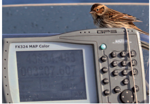
Escribano pigmeo Emberiza pusilla . Aguas del golfo de Vizcaya, 26 de octubre de 2014.