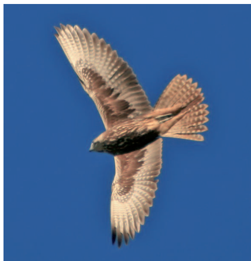
Halcón sacre Falco cherrug . Basses de Lluriach, Mallorca, 5 de enero de 2013.

Después de comprobarse la llegada natural al oeste de Europa a partir de jóvenes marcados con telemetría en sus nidos de Europa central (por ejemplo, el ejemplar de nombre Piros en España o Eonka en Francia; www.sakerlife.mme.hu/en/gmap ), todas las aves juveniles en su primer invierno avistadas entre junio y mayo que no muestren indicios de cautividad, son susceptibles de ser consideradas como de categoría A en territorio peninsular y balear. La cita de Menorca, a principios de enero, encajaría dentro de este patrón, ya que se trata de un juvenil en migración o invernada a tan solo 350 km de Cerdeña, una loca-