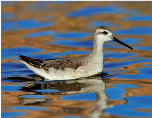
Falaropo tricolor Phalaropus tricolor. La Marena del Médano, Tenerife (Santa Cruz de Tenerife), 29 de octubre de 2014.