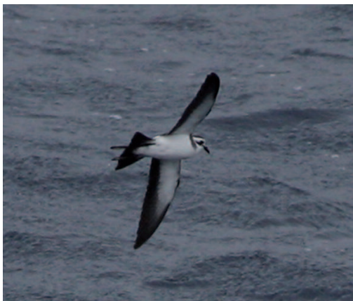
Paíño pechialbo Pelagodroma marina . Banco de Galicia, 15 de septiembre de 2012.

(Archipiélagos de Azores, Madeira y Canarias en el caso de baroli , Cabo Verde en el caso de boydi e islas del Caribe en el caso de lherminieri ). La escasa calidad de las fotografías obtenidas no permite precisar de qué especie de este complejo se trata. Algunos rasgos que sí son apreciables, tales como la ausencia de panel pálido en grandes cobertoras o la extensión del negro en la cara hacen poco probable que se trate de baroli , quizás la especie más previsible en la zona. A su vez, la identificación en el campo de boydi y lherminieri