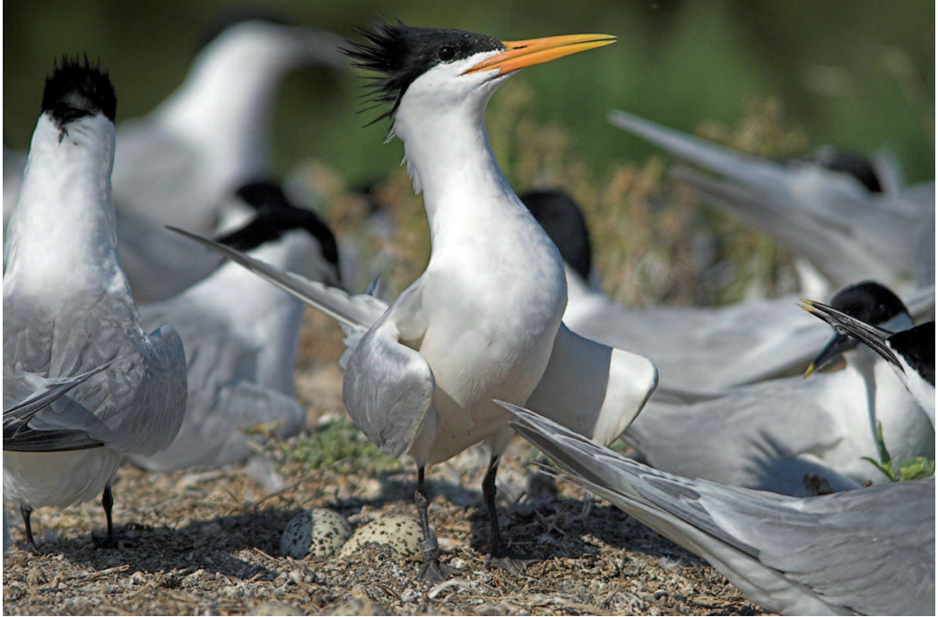
Charrán elegante Sterna elegans . Albufera de Valencia (Valencia), 24 de mayo de 2006. Macho con anilla metálica (antes de que se le colocara la anilla amarilla), criando en la Albufera por primera vez en 2006.

Tarragona. Delta del Ebro. (La misma pareja observada el mismo año en Valencia), del 18 al 23 de julio (Thomas Kupper) (2). Véase debajo en 2002 y en 2009.