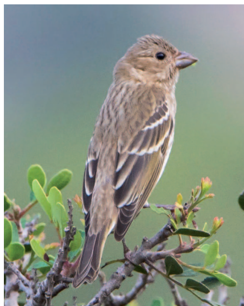
Camachuelo carminoso Carpodacus erythrinus . Cabrera (Illes Balears), 12 de octubre de 2014.

2014. Girona. Pla de la Riera d'Arbúcies, Sant Feliu de Buixalleu, un ejemplar juvenil, fotos, 11 a 15 de septiembre, fotos (Arnau Tolrà; Ponç Feliu) (12).