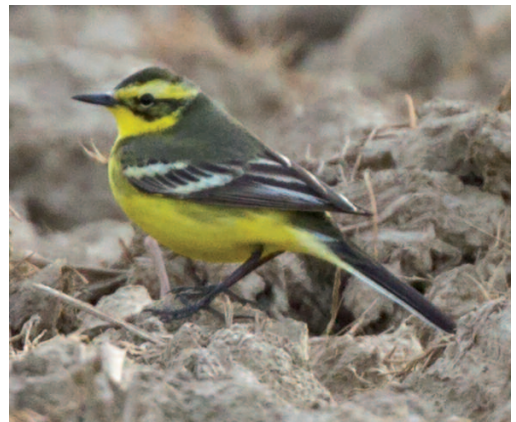
Lavandera boyera × cetrina Motacilla flava × citreola . Aeródromo de Pals (Girona), 1 de abril de 2014.

Como consecuencia de dicha expansión, la lavandera cetrina es ahora más regular y abundante en España durante sus migraciones, lo que ha provocado su salida de la lista de rarezas de España. Asimismo, se han documentado hasta cuatro presuntos híbridos, dos de ellos incluidos en este informe. Hasta el momento, todos los datos provienen del extremo nordeste de la Península, siendo tres de ellos juveniles de finales de verano con un plumaje más propio de citreola , pero con un borde amarillento en las terciarias como rasgo más indicativo de la influencia de flava . El único adulto registrado hasta la fecha es de principios de primavera. Se trataba de un macho más cercano a citreola , en el que se observaba cierta influencia de flava en la coloración del dorso y la cola, patas relativamente cortas y píleo y coberteras auriculares muy oscuras (Ollé et al. , 2014). Teniendo en cuenta la complejidad taxonómica de la lavandera boyera, con múltiples subespecies