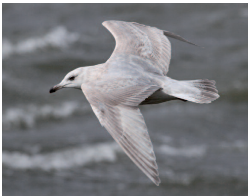
Gaviota groenlandesa 'de Kumlien' Larus glaucooides kumlieni . Playa de Cariño (A Coruña), 9 de febrero de 2014.

(Nordeste de Canadá, Groenlandia). El Comité considera probada la presencia regular de la especie para la subespecie nominal glaucooides , que deja de ser considerada rareza a partir del