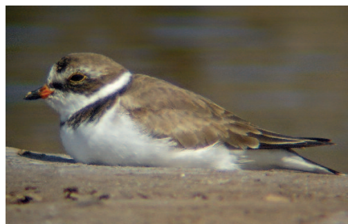
Chorlitejo semipalmeado Charadrius semipalmatus . Salinas de Arinaga, Gran Canaria (Las Palmas), 19 de junio de 2010.

(Norteamérica). Se rescata una cita de 2010 a partir de una fotografía que apareció en una publicación sobre las aves de Gran Canaria. Curiosamente, la observación se produjo entre los meses de junio y julio, unas fechas atípicas para la especie en Europa. A pesar de ello, en Azores sí se han recogido algunas observaciones estivales, algunas de ellas referentes a aves que llegan en otoño y se quedan durante un largo periodo (Matias et al. , 2012).