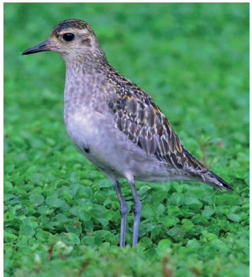
Chorlito dorado siberiano Pluvialis fulva . Delta del Ebro (Tarragona), 3 de agosto de 2014.

(Asia). Se incluye un dato de este escaso di- vagante asiático, del cual no se homologaba nin- guna cita desde el año 2007 (Dies et al. , 2009). De las cuatro observaciones recogidas en España, tres se han producido en el delta del Ebro.