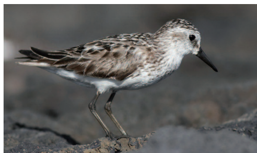
Correlimos sempalmeado Calidris pusilla . Las Salinas, La Palma (Santa Cruz de Tenerife), 6 de septiembre de 2014.