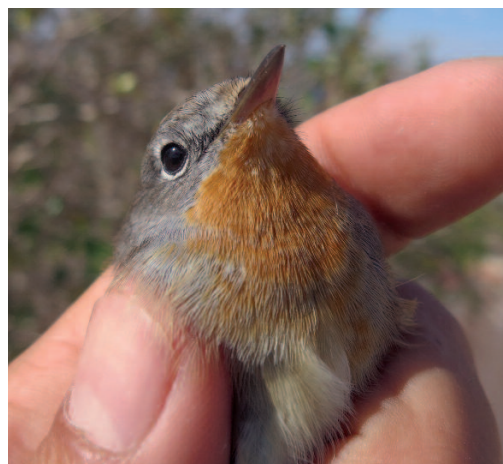
Papamoscas papirojo Ficedula parva . Isla Grosa (Murcia), 18 de octubre de 2014.

2010. Valencia. Parque Natural de la Sierra Calderona, Marines, uno de primer invierno, capturado para el anillamiento, fotos, 8 de octubre (Álex Alamán, Toni Polo) (20).