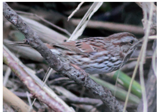
Chingolo cantor Melospiza melodia . Algeciras (Cádiz), 29 de marzo de 2013.

(Norteamérica). Primera cita para España de esta especie abundante en la costa este americana, que hasta ahora había sido referida en otros países europeos como Bélgica, Suiza, Finlandia, Noruega y Gran Bretaña, destacando este último con