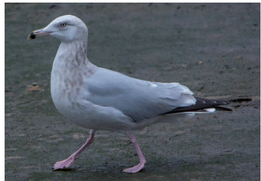
Gaviota argétea americana Larus smithsonianus . Puerto de Ondarroa (Bizkaia), 27 de diciembre de 2014.

2014. A Coruña. Playa de Cariño, Cariño, uno de primer invierno, fotos, 30 de diciembre (Ricardo Hevia) (2).