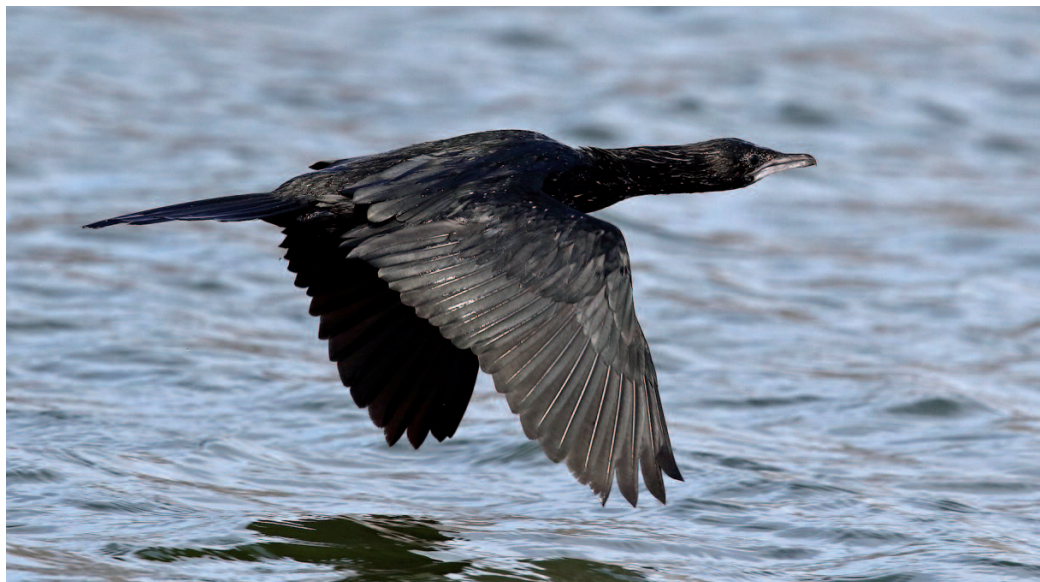
Cormorán pigmeo Phalacrocorax pygmeus . Aiguamolls de l'Empordà (Girona), 13 de diciembre de 2014.

tuar dispersiones fuera de la temporada la cría (la cual es muy variable entre las diferentes poblaciones) desde sus colonias de Cabo Verde, islas del Caribe u otras islas atlánticas.