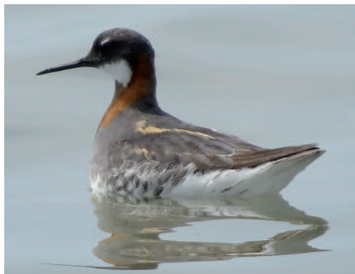
Falaropo picofino Phalaropus lobatus . Delta del Ebro (Tarragona), 17 de junio de 2014.