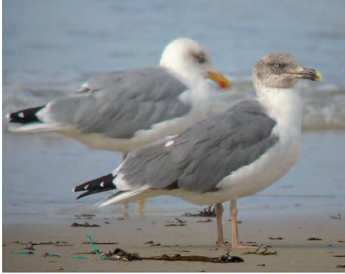
Gaviota patiamarilla Larus michahellis atlantis . Playa de Louro (A Coruña), 14 de octubre de 2012.

ra de conocer la posición taxonómica exacta de las aves de Canarias (hasta la fecha consideradas igualmente atlantis , pero sin presentar en tan alto porcentaje las características propias de esta