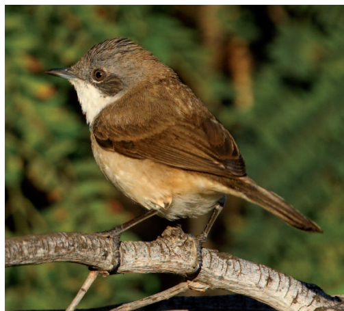
Curruca zarcerilla Sylvia curruca blythii/halimodendri . Teguisse, Lanzarote (Las Palmas), 7 de enero de 2014.

(Eurasia). Se homologa la primera observación en España de un ejemplar de una de las subespecies orientales, referente a un ave solo observada en el campo (no oída) pero de la que se consiguieron buenas fotografías. Recientemente se ha publicado una revisión taxonómica del complejo curruca que ha supuesto importantes cambios en cuanto a los límites de distribución de cada una de las subespecies (Olsson et al. , 2013), con el subsiguiente efecto en la identificación de los ejemplares divagantes. Tradicionalmente, se había considerado que minula y/o halimodendri aparecían en Europa como divagantes relativamente regulares, generalmente en otoño y en algunos casos llegando a invernar. Paralelamente, la subespecie blythi , a la que habían dado nombre Ticehurst y Whistler en 1993, había quedado en el olvido al ser considerada sinónimo de curruca por Shirihai et al. , 2001. Todo esto cambió con el ya mencionado trabajo de Olsson y colaboradores, donde se presenta una distribución de minula mucho más reducida y restringida al sudeste de