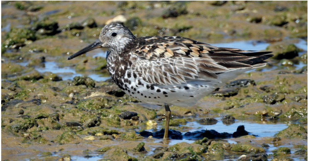
Correlimos grande Calidris tenuirostris . Punta del Malandar, Almonte (Huelva), 1 de julio.

Tarragona. El Trabucador, delta del Ebro, Sant Jaume d'Enveja, un ejemplar, fotos, 12 de febrero (Vittorio