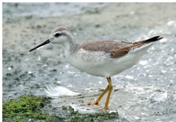
Falaropo de Wilson Phalaropus tricolor . Barreiros (Lugo), 4 de octubre.