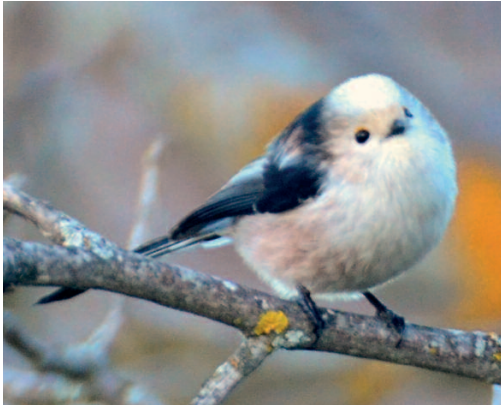
Mito Aegithalos caudatus europaeus . Portillo (Valladolid), 28 de noviembre.