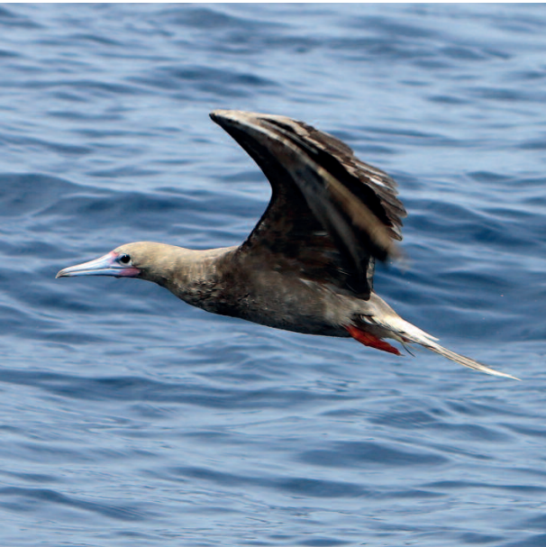
Piquero patirrojo Sula sula . La Gomera (Santa Cruz de Tenerife), 22 de agosto. Foto: Ulla Christina Ludewig.

2017. Las Palmas. Corralejo, Fuerteventura, un juvenil, fotos, 25 de noviembre (Vernon Lundy) (3).