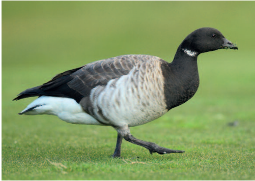
Barnacla carinegra 'groenlandesa' Branta bernicla hrota . Buenavista del Norte, Tenerife (Santa Cruz de Tenerife, 16 de febrero.

febrero a 23 de febrero (Beneharo Rodríguez, Juan Curbelo, Airam Rodríguez, Domingo Trujillo, Rob Batchelder) (1, 3).