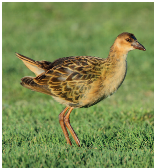
Calamoncillo africano Porphyrio alleni . Jardines del Campo de Golf de Buenavista del Norte, Tenerife (Santa Cruz de Tenerife), 21 de diciembre.

Santa Cruz de Tenerife. Campo de golf de Buenavista del Norte, Buenavista del Norte, Tenerife, un