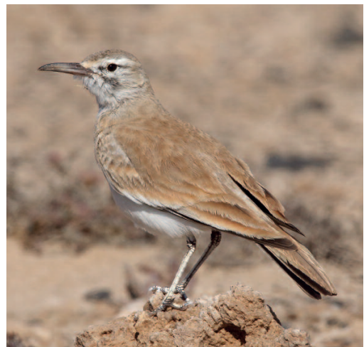
Alondra ibis Alaemon alaudipes . Punta Pesebre, Morrojable, Fuerteventura (Las Palmas), 16 de diciembre.

(Norte de África y Oriente Medio). Tal y como se comentó en el anterior informe, se produjo un importante lapso de casi veinte años sin observaciones de esta alondra en las islas, para ahora registrarse en dos años consecutivos. Destaca la primera cita que se homologa fuera del sector oriental del archipiélago, concretamente en la isla de Gran Canaria, apareciendo además este ejemplar en un hábitat sumamente atípico para la especie. Igualmente destacable, esta vez en cuanto al número de aves involucradas, es la cita de Fuerte-