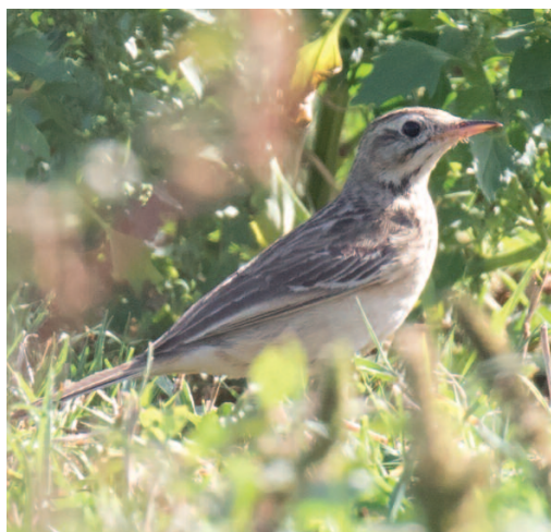
Bisbita estepario Anthus godlewskii . Villamil, Tapia de Casariego (Asturias), 27 de octubre.

(Asia central; Mongolia, montes Altai al sur de Rusia y nordeste de China).