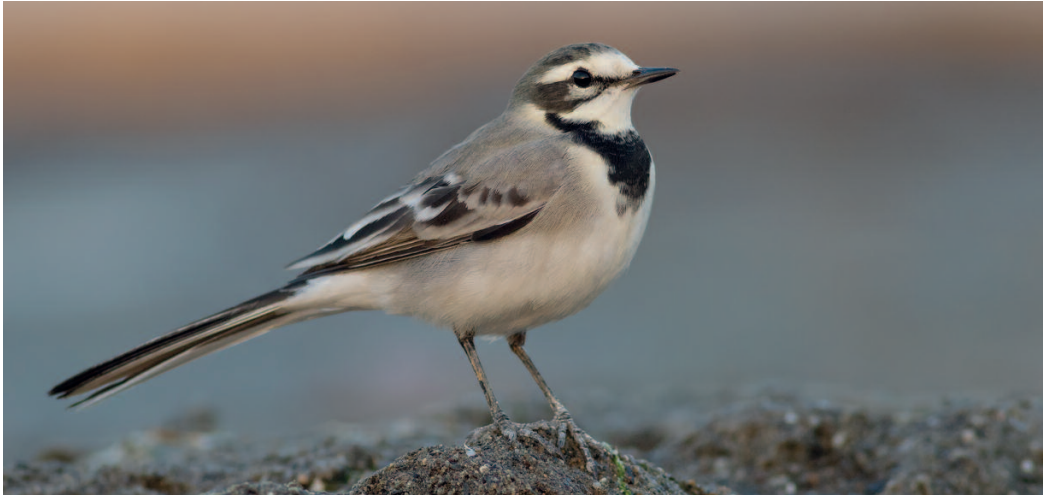
Lavandera blanca 'norteafricana' Motacilla alba subpersonata . Playa de Sacaba (Málaga), 7 de octubre.