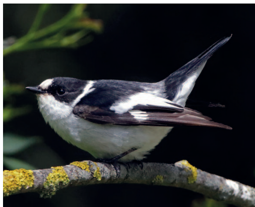
Papamoscas acollarado Ficedula albicollis . Sa Roca, albufera de Mallorca, Muro (Illes Balears), 30 de abril. Foto: Maties Rebassa.

Illes Balears. Portocolom, Felanitx, Mallorca, un ejemplar, fotos, 3 de noviembre (Steve Nicoll) (1).