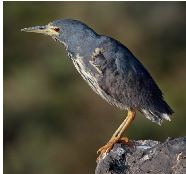
Avetorillo plumizo Ixobrychus sturmii . Barranco de Río Cabras, Puerto del Rosario, Fuerteventura (Las Palmas), 2 de enero de 2018.