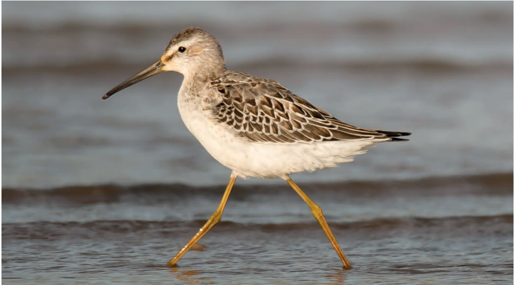
Correlimos zancoín Calidris himantopus . Embalse de Finisterre, Turleque (Toledo), 15 de septiembre.

Pedrocchi) (3). Migjorn, delta del Ebro, Sant Jaume d'Enveja, un ejemplar, fotos, 13 de mayo (Manolo García) (3).