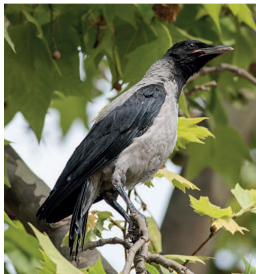
Pollo de Corneja cenicienta Corvus cornix . El Prat de Llobregat (Barcelona), abril de 2017.

*Barcelona. Delta del Llobregat, El Prat de Llobregat. Se confirma el primer caso de reproducción de esta especie en España tras un primer intento fallido en la misma localidad en mayo de 2016. La misma pareja vuelve a construir el nido a partir del mes de