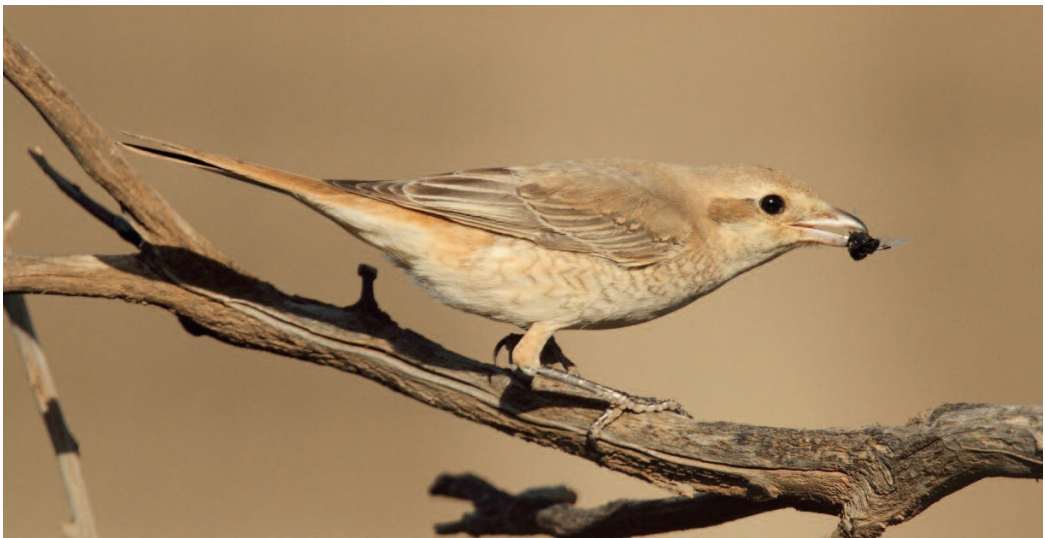
Alcaudón isabel Lanius isabellinus isabellinus . Inmed. Montaña de Taco, Buenavista del Norte, Tenerife (Santa Cruz de Tenerife).

el norte de Italia, Serbia y Bulgaria y el NE de Turquía). Primera cita homologada para el conjunto nacional de este taxón propio del centro y este de Europa. De todas las subespecies de mito reconocidas, solo la norteña caudatus tiende a realizar movimientos invernales de cierta magnitud, irrumpiendo en ocasiones en los países centroeuropeos. No obstante, ciertas poblaciones de la subespecie europaeus también realizan pequeños desplazamientos en invierno, que en ocasiones pueden alcanzar distancias considerables. La identificación a nivel subespecífico no siempre es sencilla, debido en parte a las extensas áreas de solapamiento que existen entre caudatus y europaeus a lo largo de Dinamarca, Polonia, pequeñas áreas de Ucrania, Rumanía, Moldavia y los Balcanes, y que frecuentemente generan aves de aspecto intermedio. El ejemplar de Valladolid era justamente uno de ellos, con un aspecto bastante próximo a la subespecie nominal pero con una ceja poco conspicua desde el ojo hacia detrás. El estatus taxonómico de subespecie explicaría en cierta medida la falta de registros hasta la fecha en Iberia, por el menor interés que suscita esta categoría entre los observadores de aves españoles, pero un ejemplar como el observado en Valladolid difícilmente habrá pasado desapercibido.