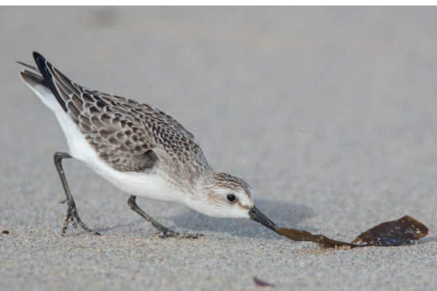
Correlimos semipalmado Calidris pusilla . Playa de Rostro, Fisterra (A Coruña), 12 de septiembre.

(Nordeste de Europa, Siberia). La observación de mayo de 2017 corresponde a la primera de un ejemplar anillado. Llevaba dos anillas de color amarillo, una en cada tibia. Gracias a la ayuda de Antonio Gutiérrez, se descubrió que el ejemplar había sido anillado como pollo en la población reproductora de Oulu (Finlandia), en junio de 2005. Este ejemplar precisamente tiene un largo historial: desde 2007 se ha detectado prácticamente de forma anual en la misma zona donde nació, donde se ha establecido como un macho reproductor (de los pocos que quedan en la población finesa, en declive). Además, el ejemplar se ha avistado en distintas ocasiones en el sureste de Suecia (en mayo, junio o julio de distintos años) y también en una ocasión en los Países Bajos (julio de 2014). Cómo el propio anillador describe en Pakanen (2016), se conoce de otros Andarríos del Terek anillados en Finlandia que han seguido una ruta migratoria a través del centro y oeste de Europa, sugiriendo que los sitios de invernada se encuentran probablemente en el Mediterráneo occidental o en el oeste/centro de África. Además, dichos ejemplares parecen ser bastante fieles a los sitios de parada durante la migración y de invernada. La disminución de la población finesa podría estar relacionada con la desaparición de ejemplares invernantes en España, lo cual pone de manifiesto que las observaciones obtenidas en años distintos pero en idénticas localidades se correspondían casi con seguridad a los mismos ejemplares.