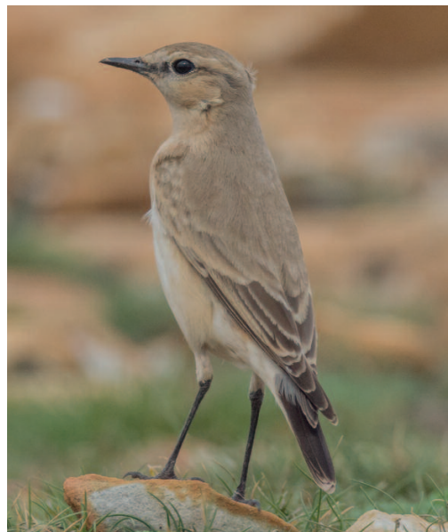
Collalba isabel Oenanthe isabellina . Cabo Peñas, Gozón (Asturias), 15 de octubre.