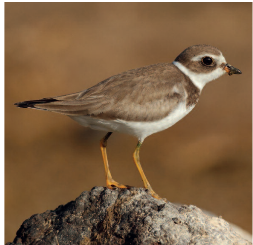
Chorlitojo semipalmado Charadrius semipalmatus . Tejita, Arona, Tenerife (Santa Cruz de Tenerife), 9 de noviembre.