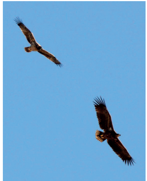
Pigargo europeo Haliaeetus albicilla . Embalse de Castrejón, Polán (Toledo), 14 de noviembre. Jose Arcadio Calvo Rubio.

2017. Cádiz. La Janda, Vejer de la Frontera, un ejemplar, fotos, 16 de enero (Ricky Owen) (2).