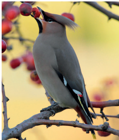
Ampelis europeo Bombycilla garrulus . Parque de las Llamas, Santander (Cantabria), 14 de enero.

(Córcega y Cerdeña). Se publican aquí tres citas nuevas, lo que supone casi duplicar las previamente homologadas en España. Todas las citas de 2017 se producen con la primavera ya avanzada,