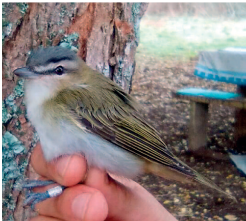
Vireo ojirrojo Vireo olivaceus . Islas Ons (Pontevedra), 29 de septiembre. Foto: Grupo Ibérico de Anillamiento.

2017. Las Palmas. El Jable, Tegui, Lanzarote, un ejemplar, fotos, 5 de febrero a 7 de febrero (Richard Katzinger) (1, 3).