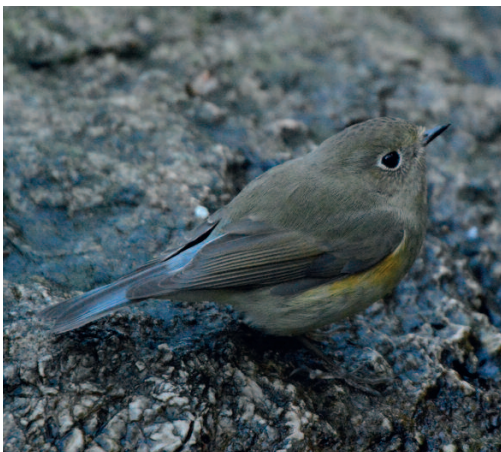
Ruiseñor coliazul Tarsiger cyanurus . Bunyola, Mallorca (Illes Balears), 18 de noviembre.

Cádiz. Se tiene constancia de observaciones intermitentes de un máximo de dos ejemplares de la especie en su localidad habitual en Punta Camorro, Tarifa, a lo largo de 2017, sin que ninguno de ellos esté anillado (en el pasado se anillaron cuatro ejemplares) (Álex Colorado, com. pers.). Sin embargo, durante el pre-