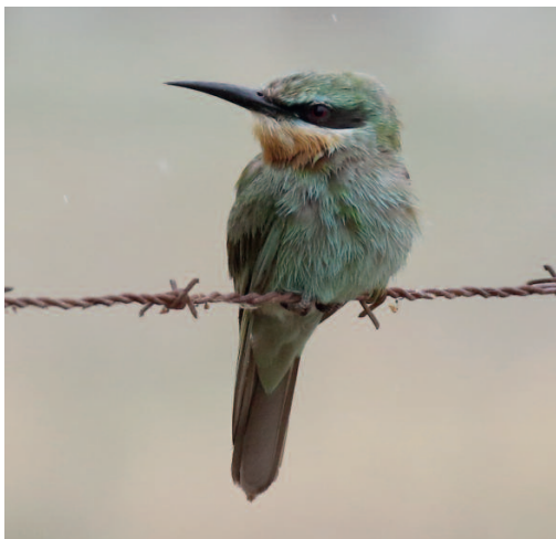
Abejaruco persa Merops persicus. Dehesa de Moheda Alta, Navalvillar de Pela (Badajoz), 28 de abril.